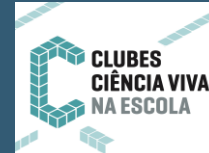
Tabela Periódica Humana

26 de janeiro – 10.30 Jardins do Palácio Marquês de Pombal Oeiras