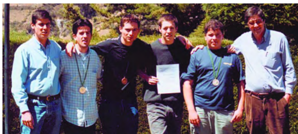
A equipa olímpica portuguesa na VI OIbF

A VII Olimpíada Ibero-americana de Física terá lugar na Guatemala em Setembro de 2002. Em La Paz a delegação de Cuba apresentou as credenciais da Sociedade Cubana de Física e do Ministério da Educação da República de Cuba, confirmando a organização da OIbF de 2003.