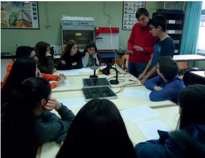
IAPS School Day, Visita às escolas - 10 de Novembro de 2016