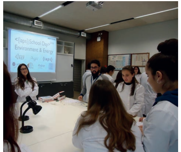
IAPS School Day, Visita às escolas - 10 de Novembro de 2016