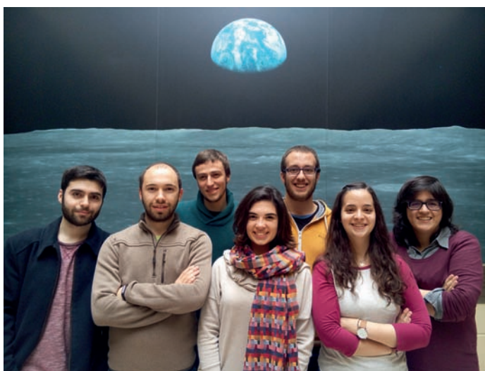
Alguns dos estudantes que dedicam parte do seu tempo ao núcleo PhysikUP.

Além de atividades de carácter local, já colaborou com outros núcleos de estudantes de física e com a SPF. Organizou em conjunto com o NEFUM (Núcleo de Estudantes de Física da Universidade