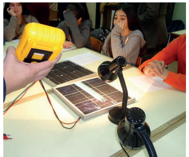
IAPS School Day, Visita às escolas - 10 de Novembro de 2016