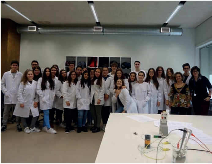
IAPS School Day, Visita às escolas - 10 de Novembro de 2016