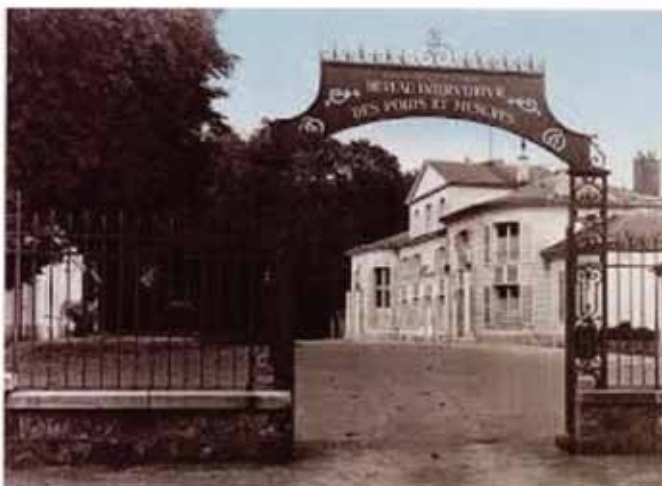
Figura 1 - Entrada do BIPM, no Pavilhão de Breteuil, França

A missão do BIPM é garantir a unificação das medidas e os respetivos objetivos são: