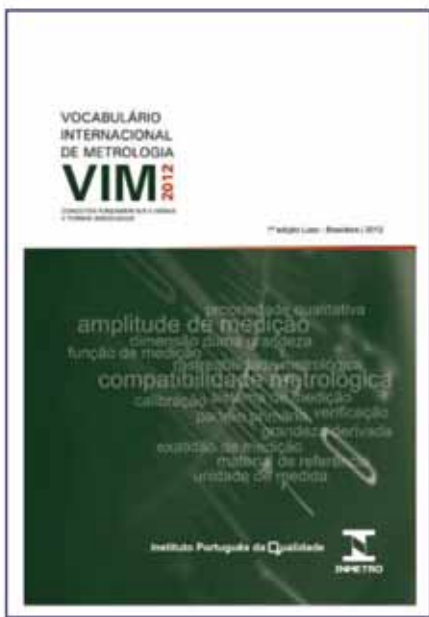
Figura 3 - Capa da 1.ª edição luso-brasileira do Vocabulário Internacional de Metrologia (VIM) [12]

Além do BIPM, com os respectivos meios de divulgação e publicação mencionados, as organizações de normalização internacionais, europeias e nacionais dão informações suplementares sobre as grandezas e unidades, assim como sobre as respectivas regras de aplicação. Quando as unidades do SI são mencionadas nos documentos normativos, a sua escrita deve refletir as regras definidas por estas organizações. As normas internacionais ISO 80000-1 e ISO 80000-2 são elaboradas pela Organização Internacional de Normalização (ISO) e apresentam informação de referência no domínio das grandezas e unidades.