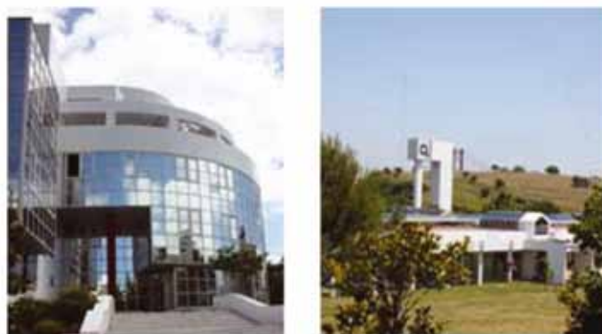
Figura 4 - O Instituto Português da Qualidade, IP

Embora sendo, desde o início, Estado-Membro da CGPM, Portugal só reconheceu o SI como sistema de unidades de medida legal em todo o território nacional a partir do Decreto-Lei 427/83 de 7 de dezembro.