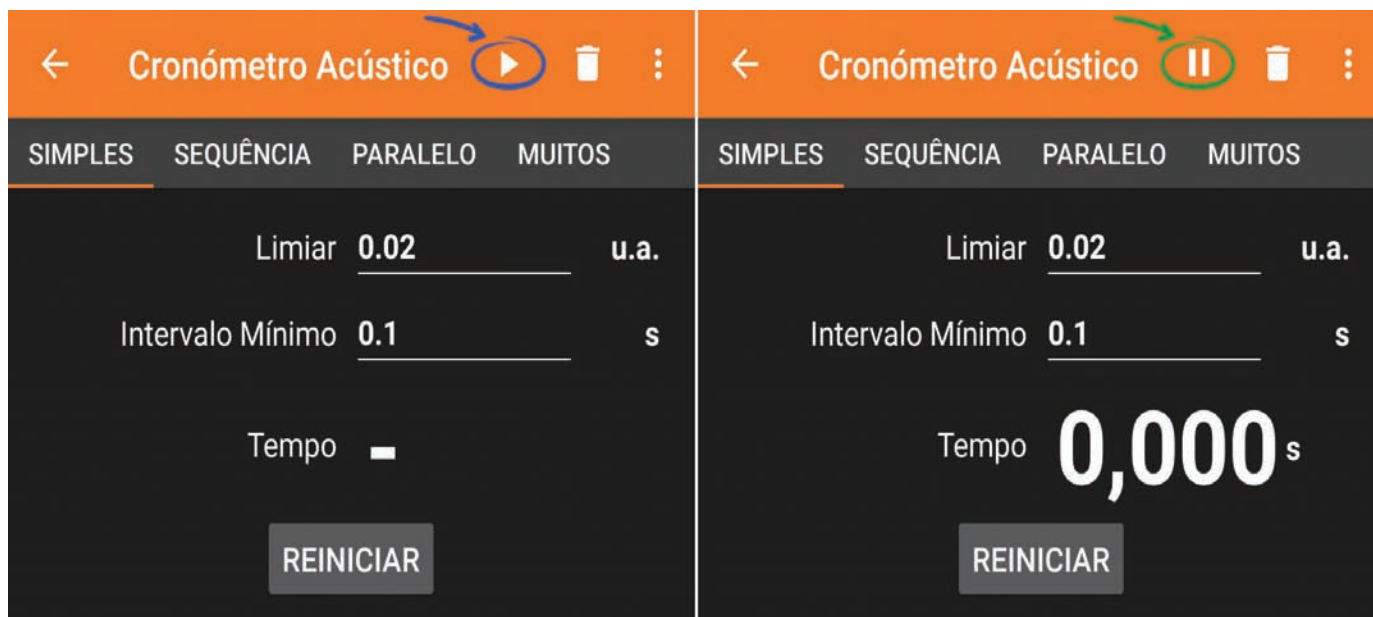
Figura 3 - Configuração da aplicação.

ro som produzido aciona o cronómetro e o segundo som detetado pelo cronómetro vai pará-lo.