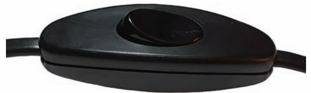
Figura 2 - Interruptor.

De seguida, abrimos a aplicação e na secção “Temporizadores” seleccionámos “Cronómetro Acústico”. Na opção “Limiar” escolhemos 0,02 u.a. e “Intervalo Mínimo” de 0,1 s (fig. 3). Depois, clicámos na parte superior no triângulo branco que estava intermitente (posição indicada pela seta azul) para mudar para dois traços brancos verticais (posição indicada pela seta verde). O telemóvel tem o cronómetro acústico pronto para detetar uma onda sonora. O primei-