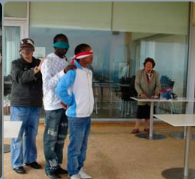
Estudantes da Escola Secundária Fernando Namora a simular um rover em Marte. Parte de um projecto apoiado por um especialista em Geologia Planetária, associado do NUCLIO.