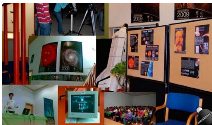
Escola Secundária da Moita

Muitas escolas adoptaram como projecto de escola a Astronomia e ao longo do ano produziram conteúdos, promoveram actividades que envolveram a comunidade local, organizaram sessões de observação com telescópios, exposições, convidaram cientistas para dinamização de palestras e abriram as suas portas para a comunidade local: