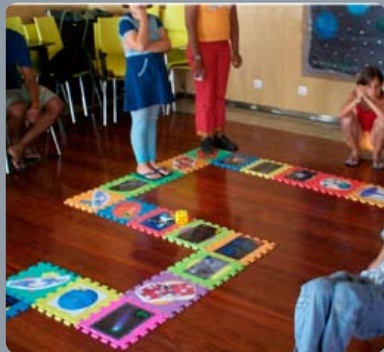
Jogo sobre o Sistema Solar onde os participantes são os peões. Esta divertida actividade é dinamizada no âmbito dos Domingos Divertidos (actividade lúdico-pedagógica realizada mensalmente no Centro de Interpretação Ambiental da Ponta do Sal em S. P. Estoril, Cascais).