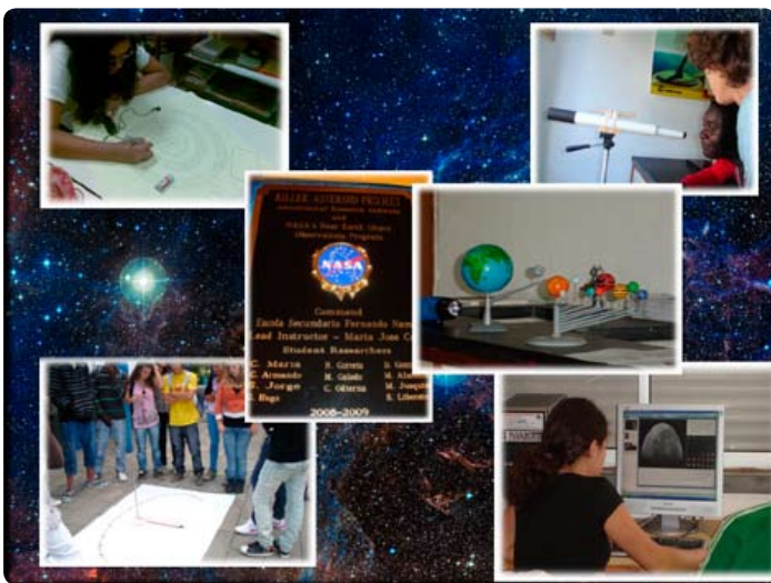
Escola Secundária Fernando Namora

Vários encontros, feiras e exposições têm sido dinamizados no Continente e nas Ilhas envolvendo as comunidades locais e enriquecendo os esforços de dinamização do AIA2009.