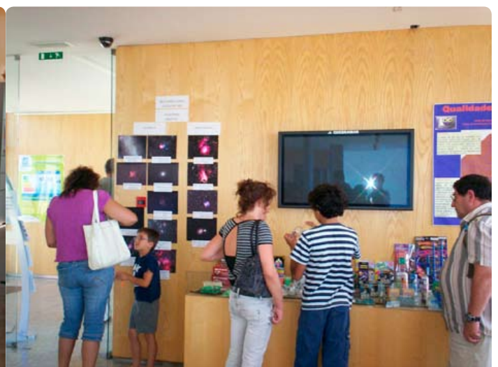
Festa das Estrelas dinamizadas pelo NUCLIO no Centro de Interpretação Ambiental da Ponta do Sal