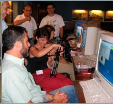
Sessão de Formação de Professores no âmbito do programa EUHOU decorrida no Instituto Geográfico do Exército.

de iluminação. As vantagens são muitas: poupança de energia, uma maior consciencialização para o problema da poluição luminosa e, claro, recuperar a beleza do céu nocturno – passo fundamental para que as pessoas possam redescobrir o seu lugar no Universo.