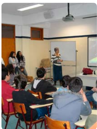
Palestras dinamizadas em escolas de 1º e 2º ciclos do ensino secundário

Mais de 150 palestras foram realizadas, desde o primeiro ciclo até o ensino secundário. A comunidade de astrónomos amadores e de instituições que regularmente promovem divulgação da ciência foi ao longo destes seis meses incansável, tanto pelo apoio que têm prestado na dinamização de sessões de observação com telescópios, como na dinamização de eventos em colaboração com o