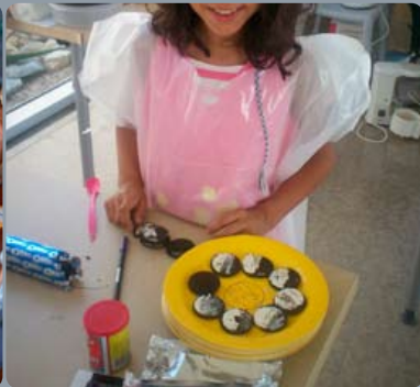
Conhecer as fases da Lua com bolachas Oréo. As crianças descobrem as fases da lua e depois deliciam-se com as bolachas. Outra actividade dinamizada no âmbito dos Domingos Divertidos (actividade lúdico-pedagógica realizada mensalmente no Centro de Interpretação Ambiental da Ponta do Sal em S. P. Estoril, Cascais).